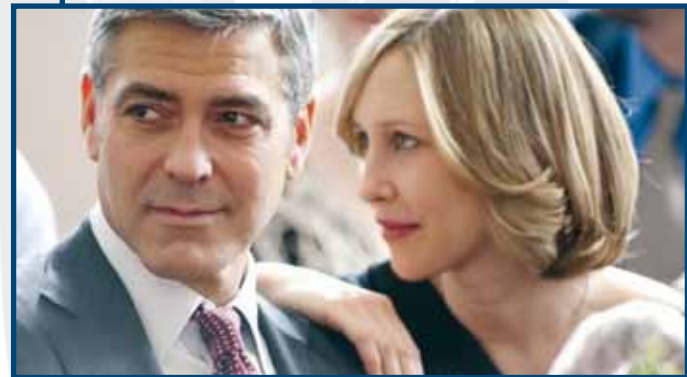
19 Luglio TRA LE NUVOLE