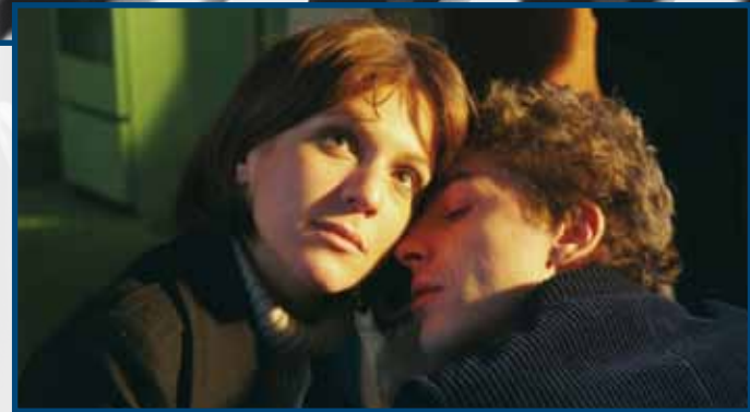
18 Luglio DIECI INVERNI