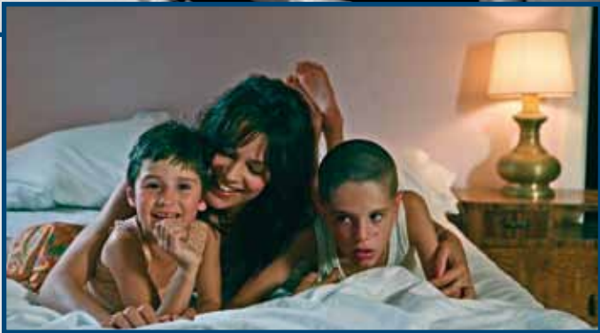
1 Luglio LA PRIMA COSA BELLA