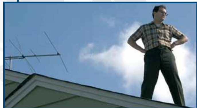
29 Luglio A SERIOUS MAN