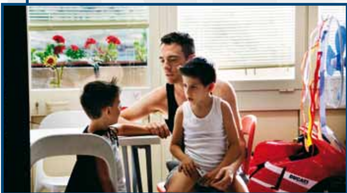
13 Luglio LA NOSTRA VITA