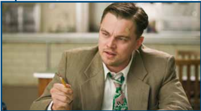
3 Luglio SHUTTER ISLAND